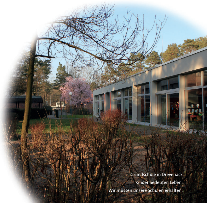
Grundschule in Drevenack Kinder bedeuten Leben. Wir müssen unsere Schulen erhalten.