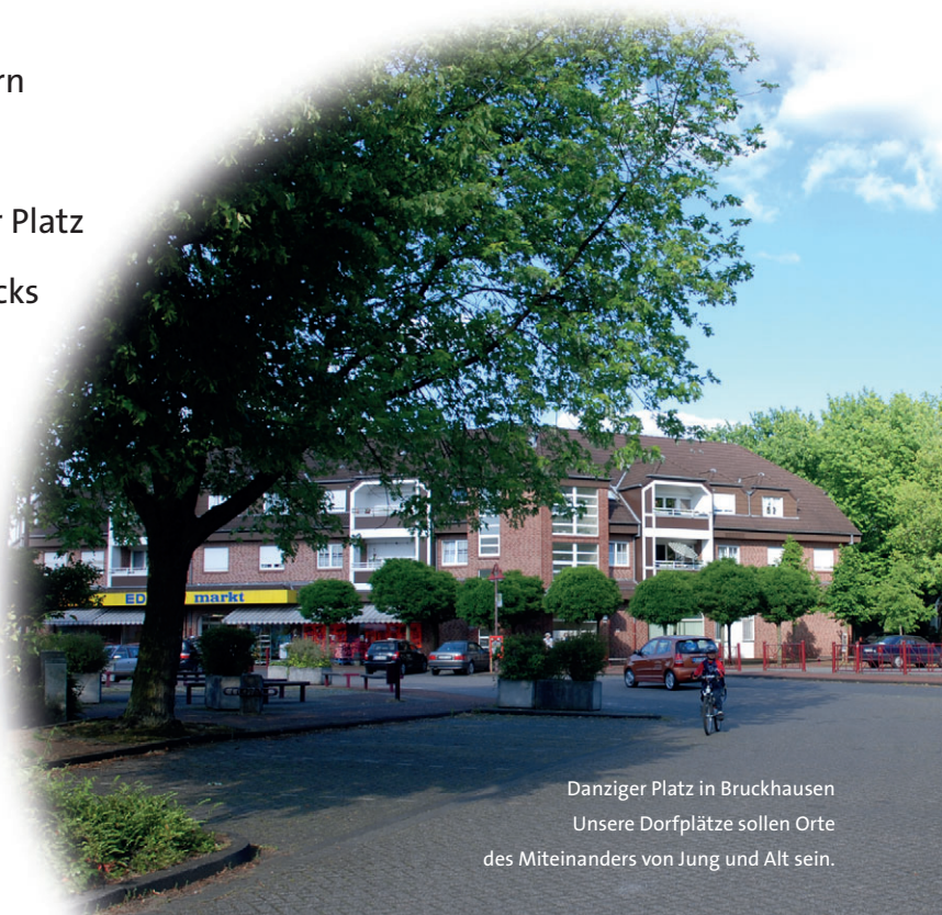
Danziger Platz in Bruckhausen Unsere Dorfplätze sollen Orte des Miteinanders von Jung und Alt sein.