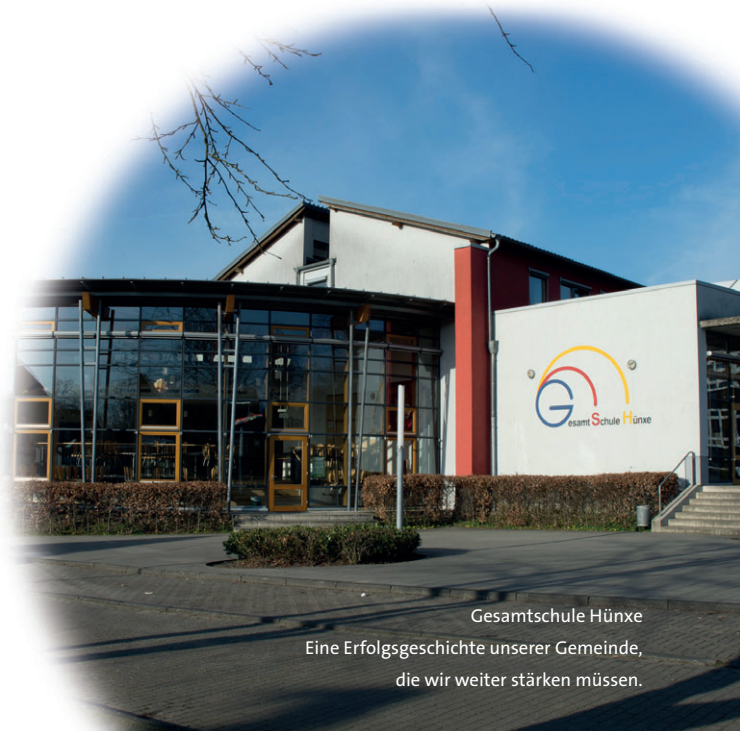
Gesamtschule Hünxe Eine Erfolgsgeschichte unserer Gemeinde, die wir weiter stärken müssen.