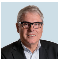
Siegmund Braune Bruckhausen/Bucholtswelmen Wahlbezirk 04 Wahllokale: Grundschule Bruckhausen (4.I) Feuerwehrgerätehaus Bucholtswelmen (4.II)